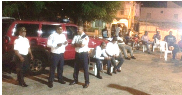
Los Bomberos invitados en tertulias