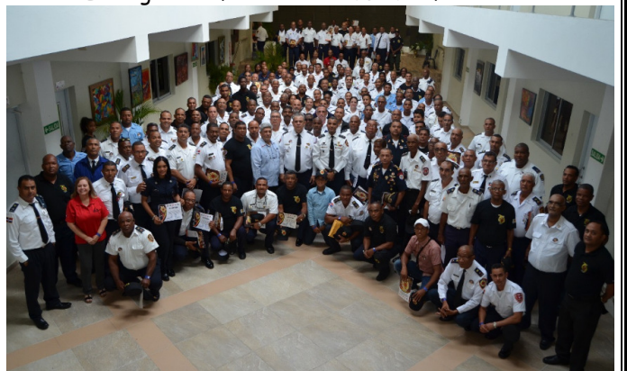
Una Foto para la Historia: 1er Congreso CB, 12-8-17