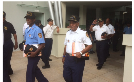
En la Despedida de los invitados