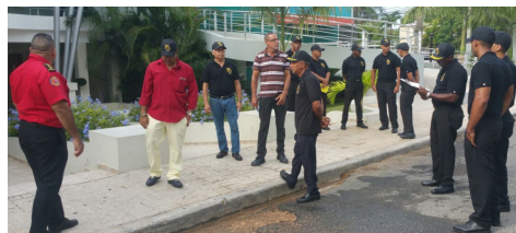
Simulacro de la Logística para el Congreso, donde participaron todos los involucrados.