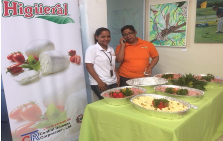
Una Picadera de los Productos Higüeral