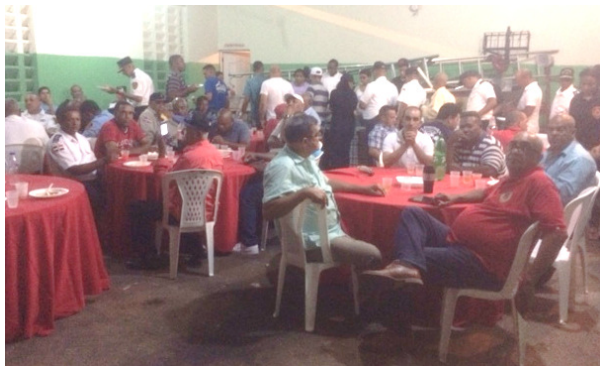
Los invitados en disfrute de la cena "Noche Criolla"