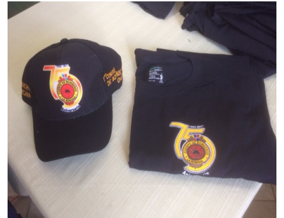
Obsequios: Gorra y Tshirt de los 75 años.