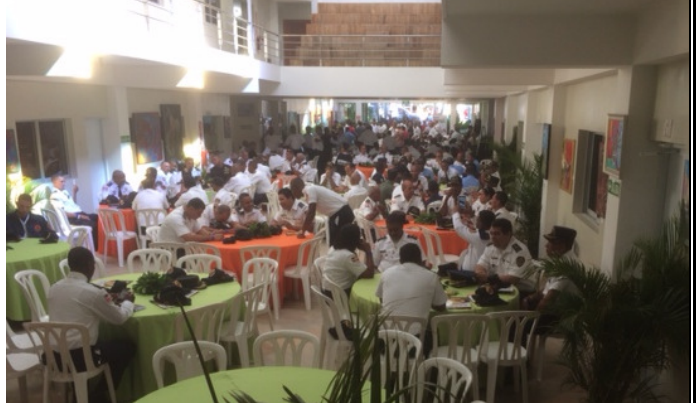
Un concurrido Bomberil en el Almuerzo