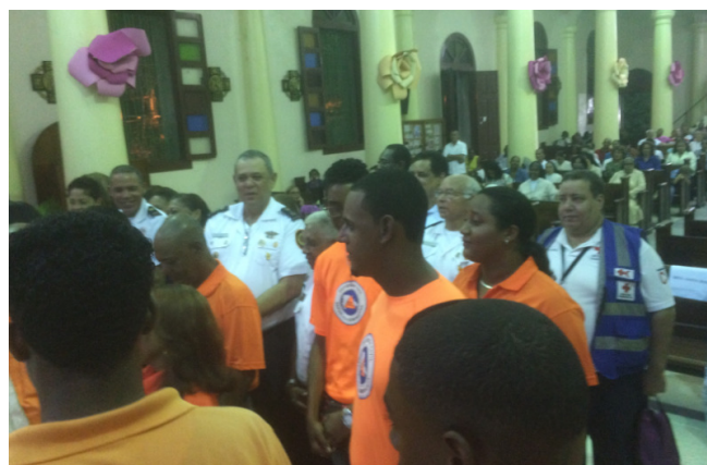
Reconocimiento a las Instituciones de Servicio Por la Iglesia Santa Rosa de Lima en sus fiestas Patronales