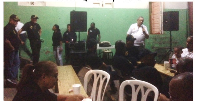
Reconocimiento a Nuestra Institución por el Cuerpo de Regidores de La Romana (25-08-17)