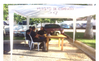
Nuestra Unidad de Rescate y Carpa en sus posiciones