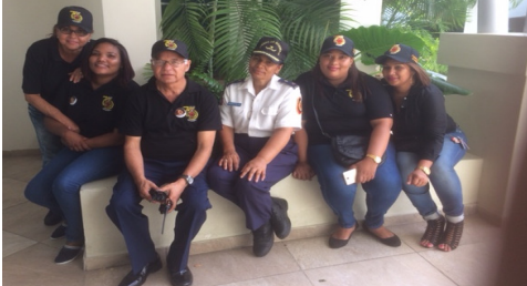
También los de la Entrada y el Desayuno