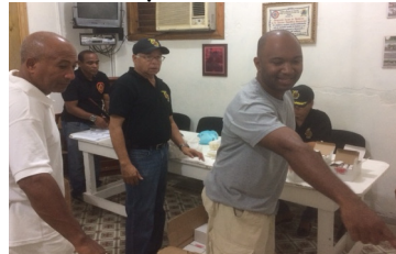
Ultima reunión de coordinación