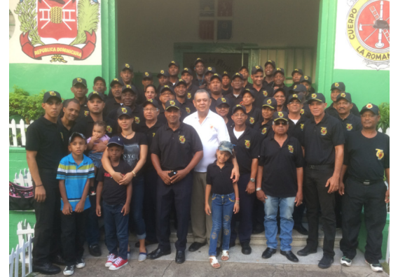
Al término del desfile: Foto de la Hermandad (16-08-17)