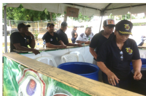
Una comidita y en la Venta de Variedades