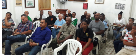
Reuniones de información y Sesión permanente