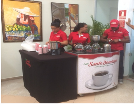
Degustación cafetalera con Café Santo Domingo