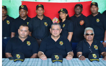
Rueda de prensa

1- Durante las Preparaciones de Nuestro 75 Aniversario: Un Hecho para nuestra Historia