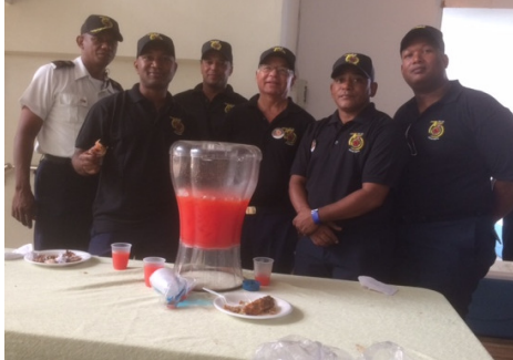
Los Tremendos colaboradores en el Almuerzo