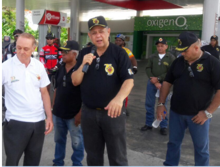
En la Salida.