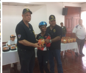
La pasamos muy bien con Buena Hermandad . Entrega de Botiquines a los ciclistas