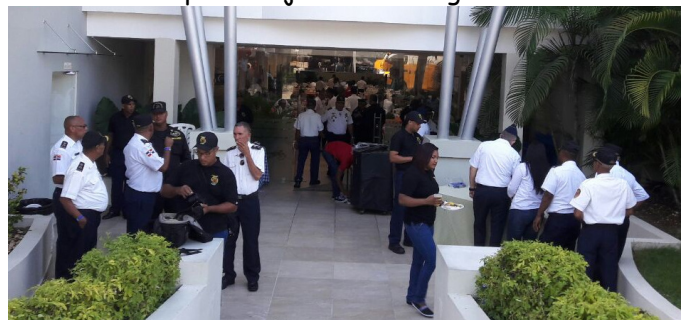
Los Delegados Bomberos Representantes