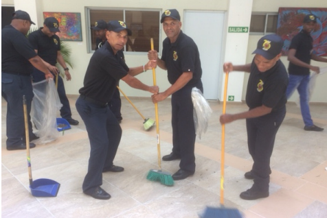
Operación Limpieza al término del Congreso