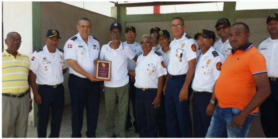
Placa de Reconocimiento a "Cibaito"