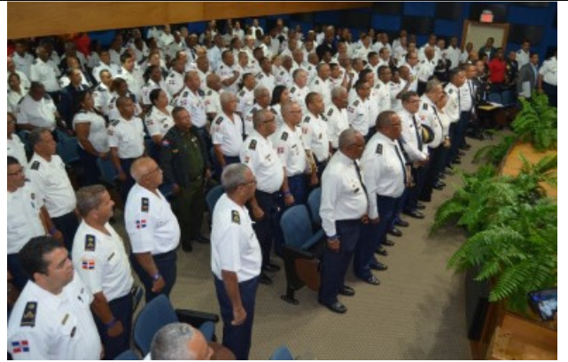
Los Delegados Bomberos Invitados