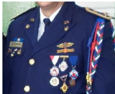
Uniforme de Gala